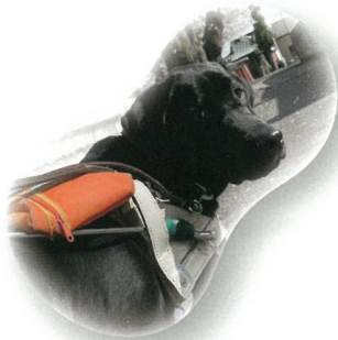
盲導犬 たいようくん (公益財団法人 日本盲導犬協会)